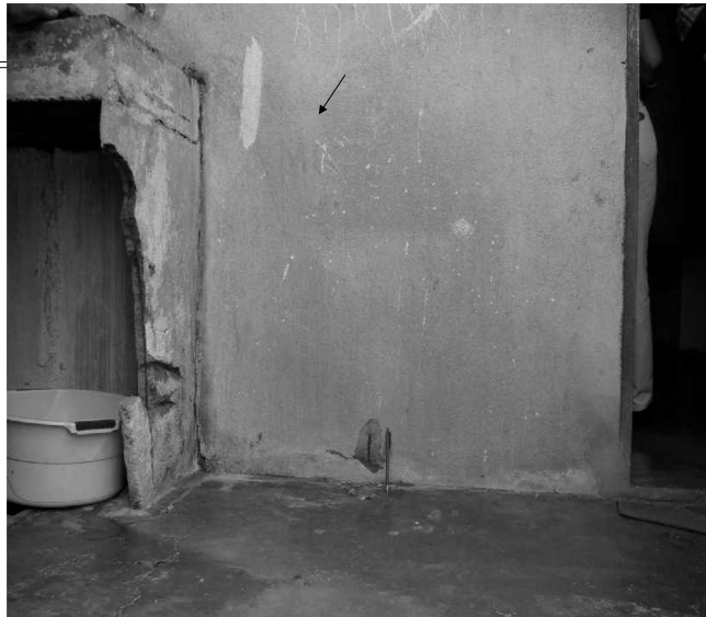
Conjunto Habitacional Santarém, com 15 anos, em Natal - RN, em jan/2001. Corrosão da armadura em parede ao lado de tanque, de área de serviço, em casa na Rua Balsa Nova, 66.